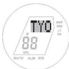
Vyberte místní město