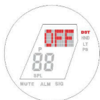
nastavení letního času