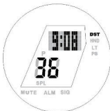
Režim světového času