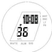
Zobrazení hodin, minut, sekund