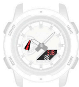
Týdenní ruční nastavení