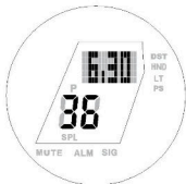
Zobrazení měsíce, dne, sekundy