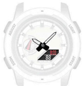
Nastavení hodinové a minutové ručičky